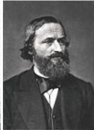
Gustav Robert Kirchhoff

Relaciones entre electricidad, calor y trabajo, 1840-1843