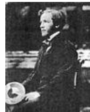
James Clerk Maxwell