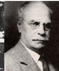
Edwin Herbert Hall