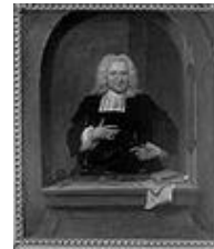
Pieter van Musschen- broek