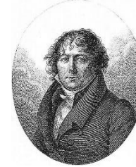
Jean Baptiste Biot