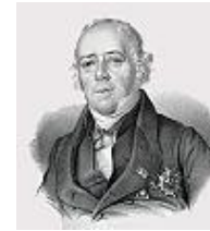
Hans Christian Oersted