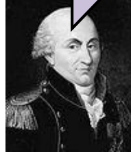
Charles- Augustin de Coulomb