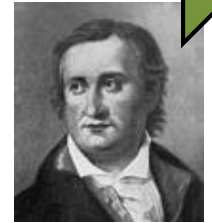
Thomas Johann Seebeck