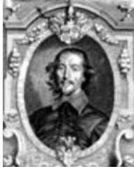
Otto von Guericke

Materiales eléctricos y materiales aneléctricos, 1600